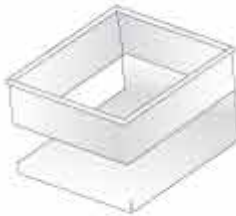
Plattform 100 x 80 cm inkl. Bordwände Flachpritsche