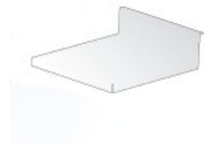
Plattform 100 x 80 cm