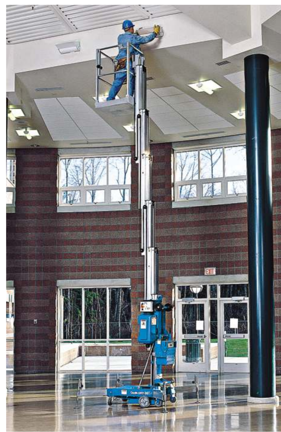
Genie Aerial Work Platform - Hubarbeitsbühne, jetzt mit mehr Extras, als jemals zuvor!