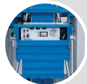
Steckdose mit FI