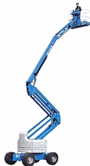
Gelenkarmbühne Mit grosser seitlicher Reichweite